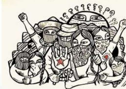
!Autonomía, dignidad y alegre rebeldía!

Debemos reconocer que existe algo denominado "discriminación interseccional" y que está vigente en gran medida dentro de las luchas feministas, en la creación y aplicación de leyes y textos normativos, así como en la selección y ocupación de puestos públicos, a los que cada vez es más difícil llegar, no por ser mujeres sino por las características que como mujeres se posee.