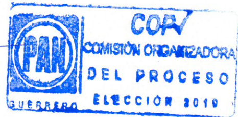
C. Sulpicio Mosso Tacuba Presidente de la COP En Guerrero.