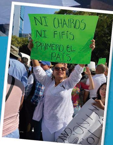
No fifis / No chairros