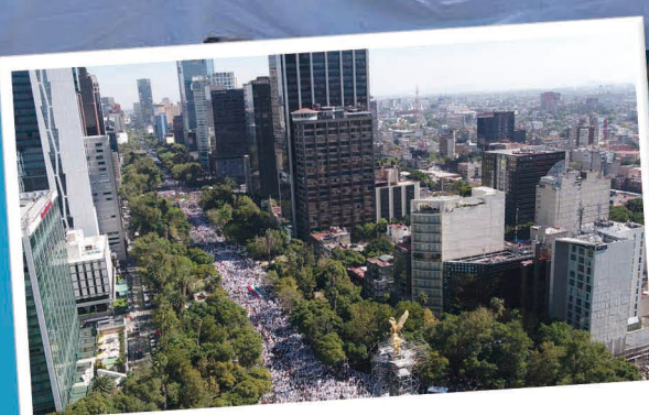
Paseo de la Reforma, CDMX